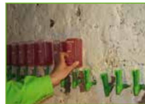
Einsetzen der Kartuschen