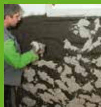
Aufbringen des KÖSTER Spritzbewurfs