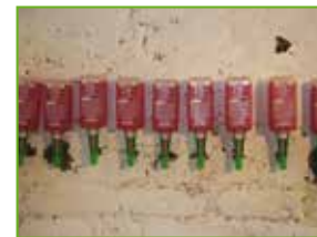
Selbständige Installation der Horizontalsperre