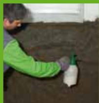
Grundieren mit KÖSTER Polysil® TG 500

KÖSTER Sanierputze wurden eigens für die Instandsetzung von Mauerwerk mit hohem Salz- und Feuchtigkeitsgehalt entwickelt. Sie verhindern, dass Salze an die Oberfläche dringen. Wenn aufsteigende Feuchtigkeit mit KÖSTER Crisin 76 Konzentrat gestoppt wurde, helfen sie bei der Trocknung der Wand und bei der Aufnahme der Salze, die beim Trocknungsprozess auskristallisieren.