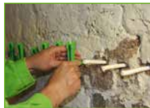
Einsetzen der KÖSTER Kapillarstäb- chen und der KÖSTER Saugwinkel