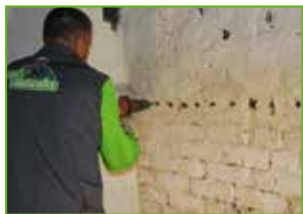
Waagerechte Bohrung in die Lagerfuge